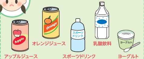
アップルジュース オレンジジュース スポーツドリンク 乳酸飲料 ヨーグルト

●このお薬の 重複投与 を避けるため、他の医療 機関で診療を受ける方は、アジスロマイシン 細粒 10%小児用「KN」を服用していた事を 医師に伝えてください。