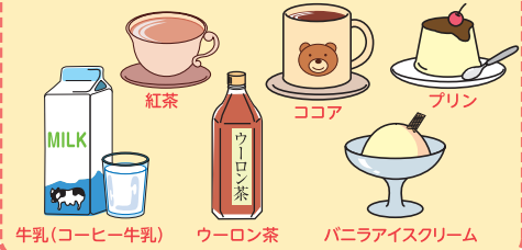
牛乳(コーヒー牛乳) ウーロン茶 パニライスクリーム

一緒に飲んでも苦味が出にくいもの お水では飲みにくいお子様に、次のような 飲み物・食べ物に混ぜてあげてください。